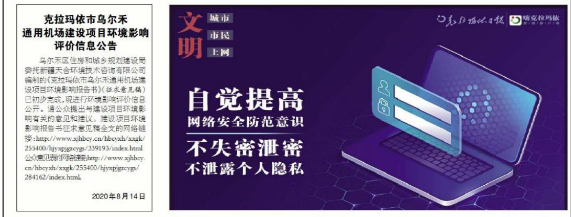
图3 本项目第一次报纸公示照片