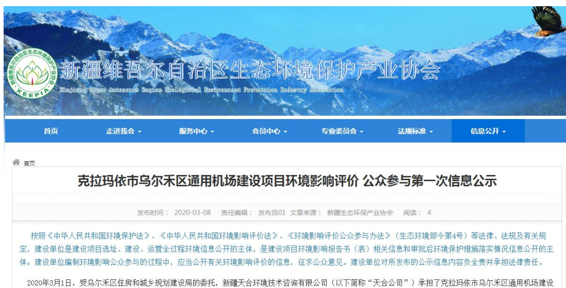
图 1 本项目第一次网络公示截图