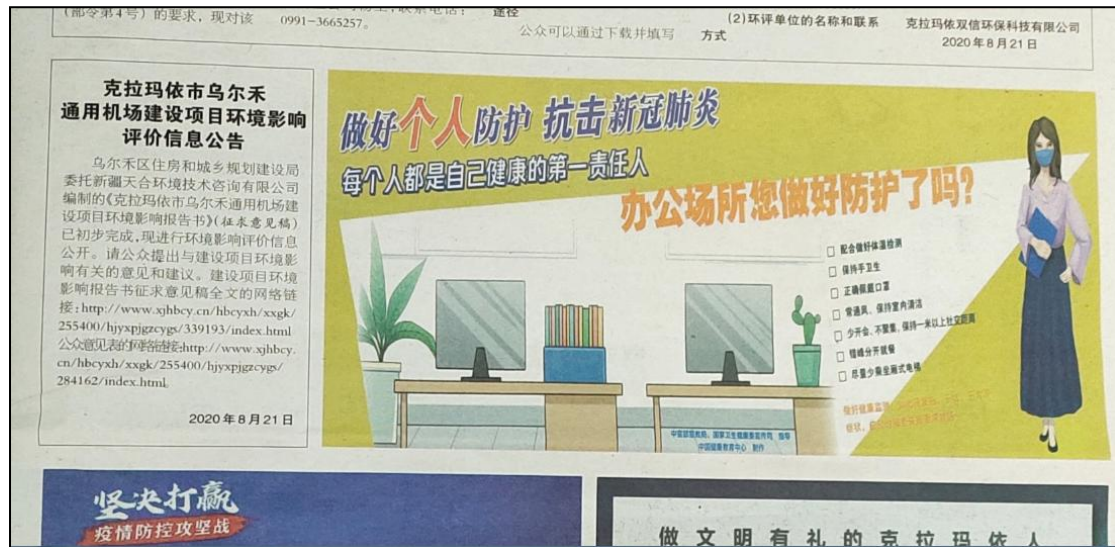
图4 本项目第二次报纸公示照片