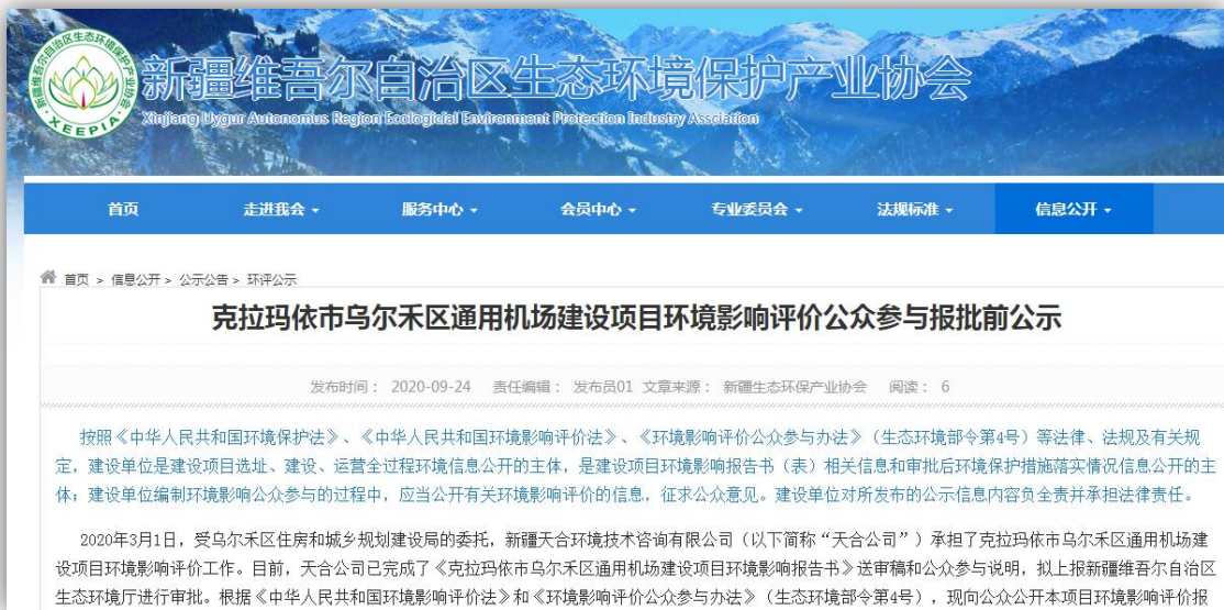
图 6.2-1 拟报批公示网页截图