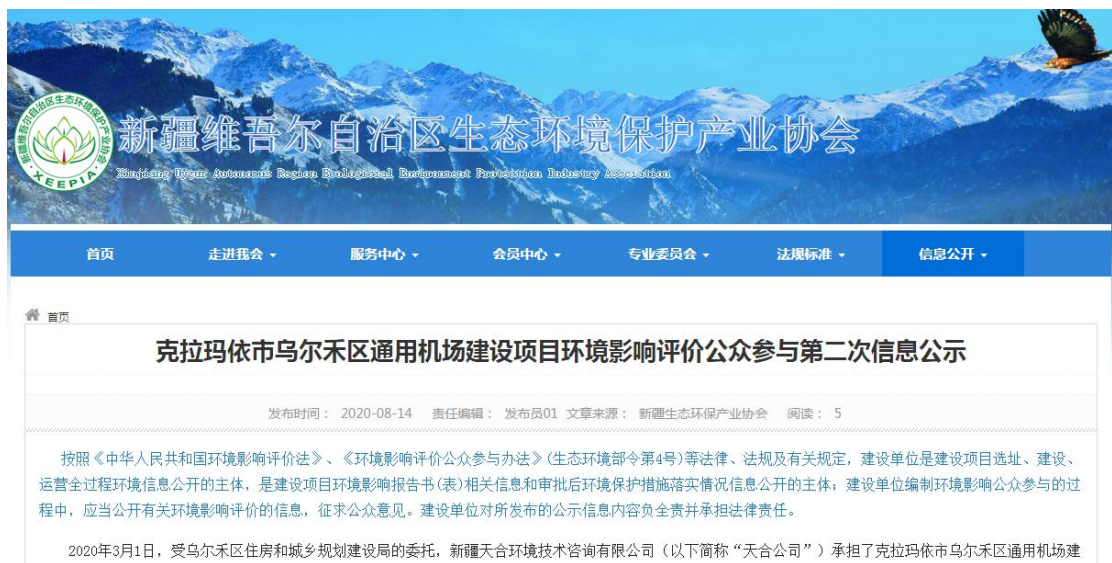
图 2 本项目征求意见稿网络公示截图