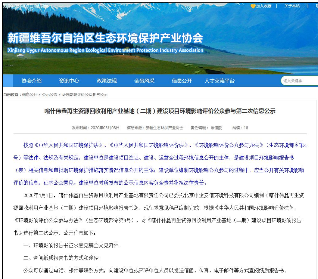
第二次网络公示截图