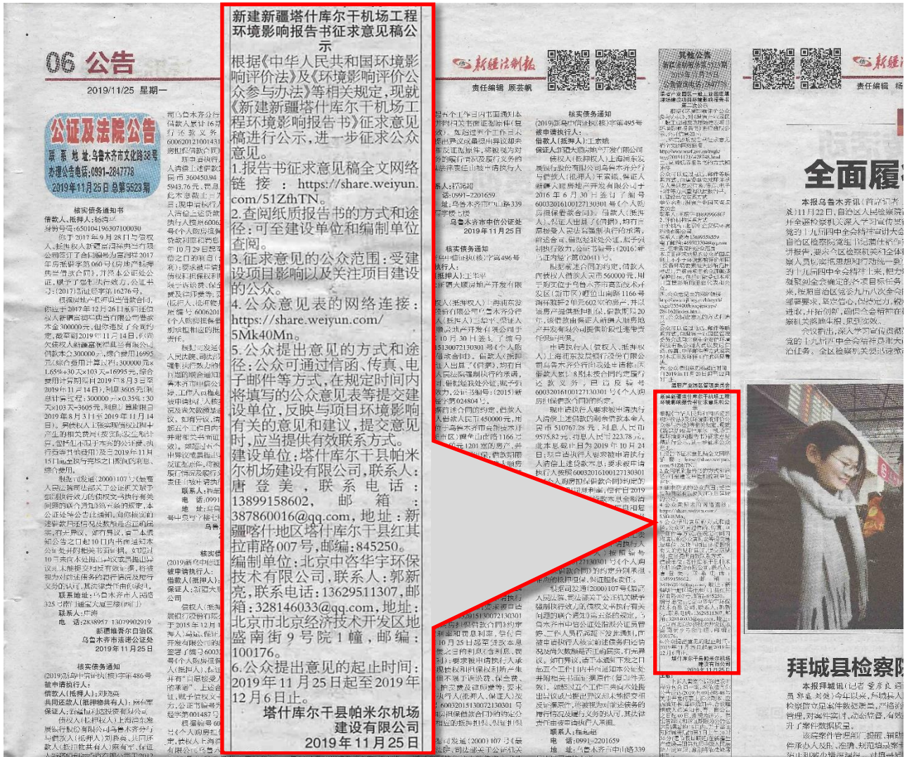
图3-2 (1) 征求意见稿报纸公示截图 (2019年11月25日)