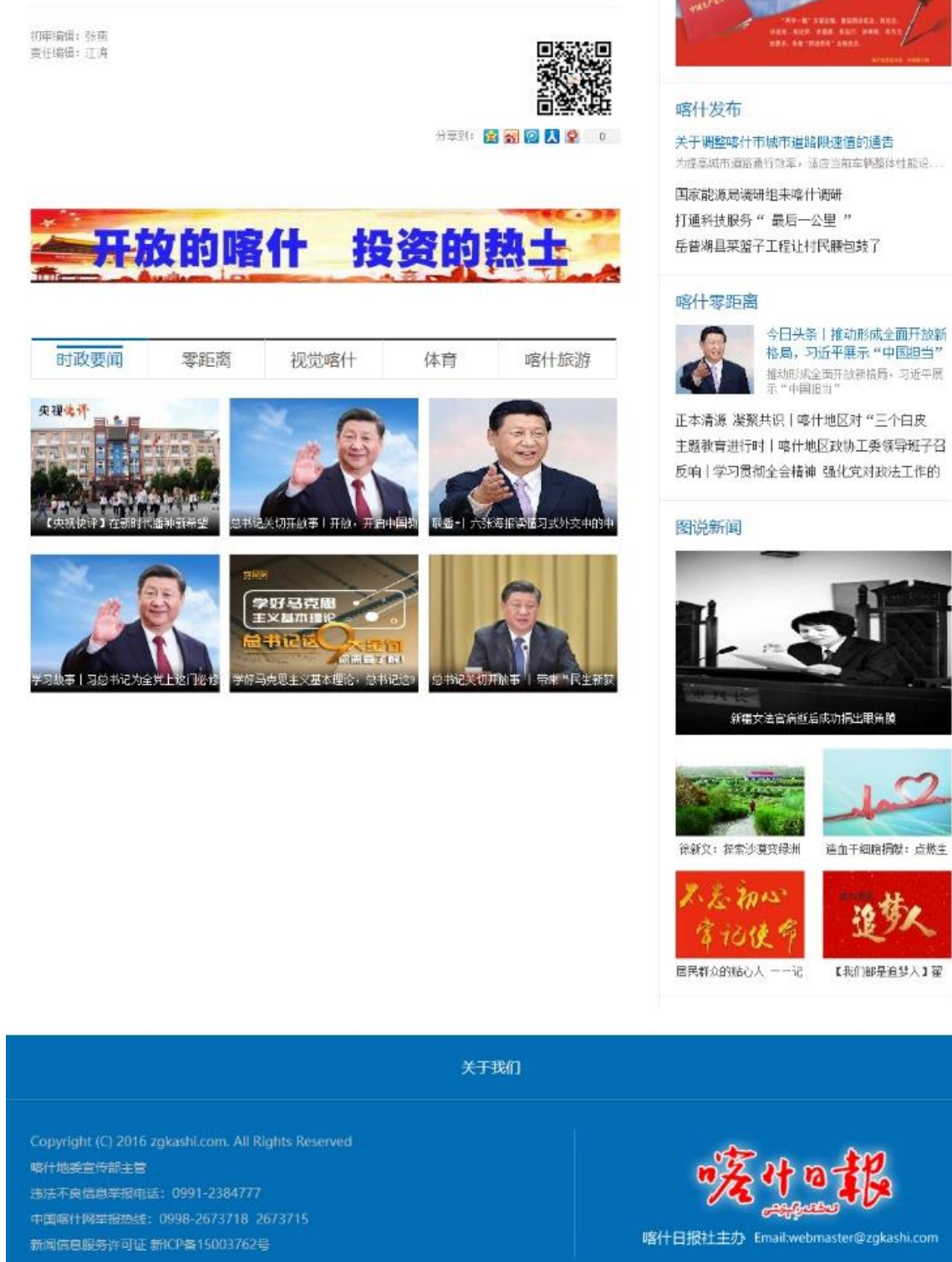
图 2-1 (2) 首次环评公开信息网络截图