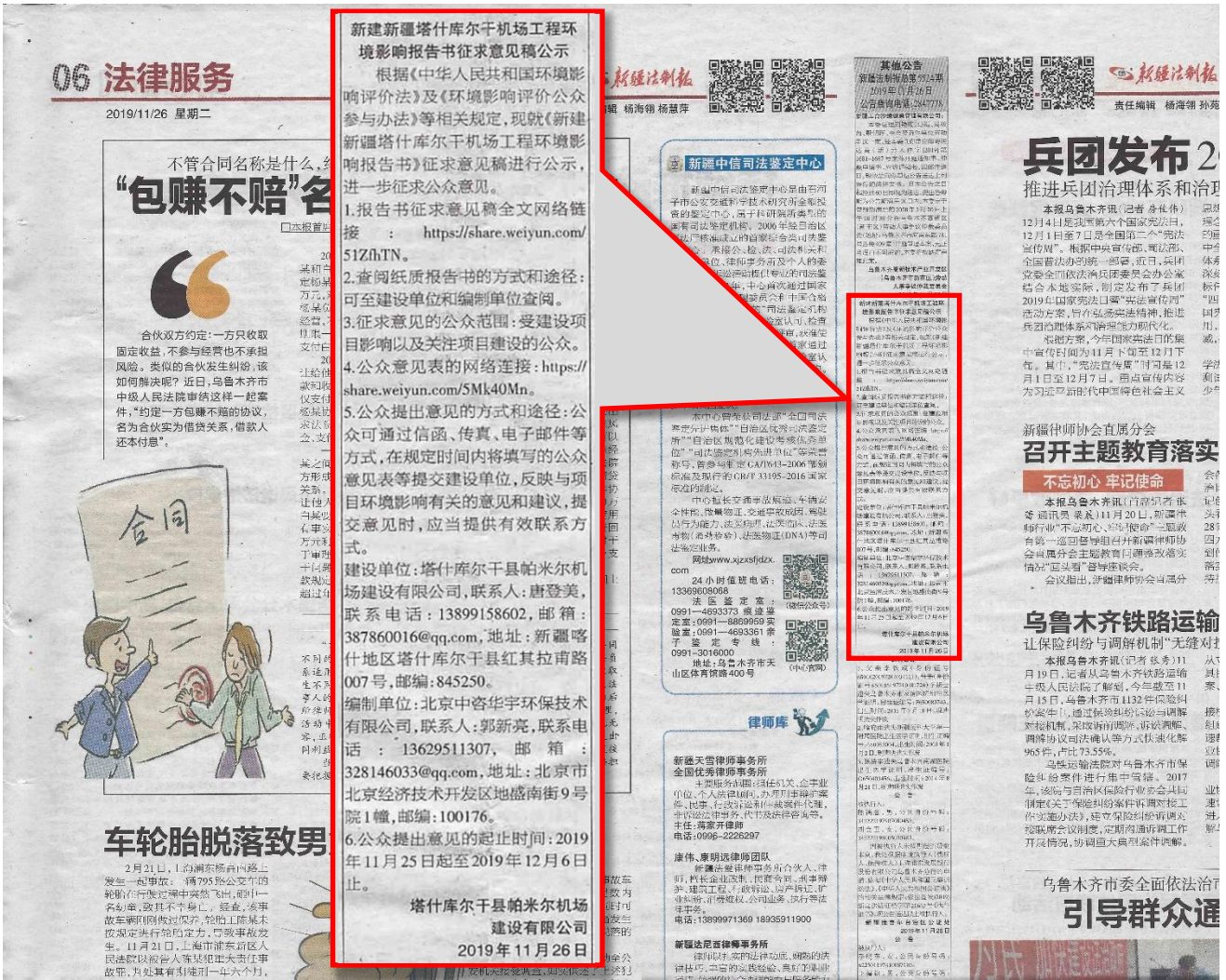
图 3-2 (2) 征求意见稿报纸公示截图 (2019 年 11 月 26 日)