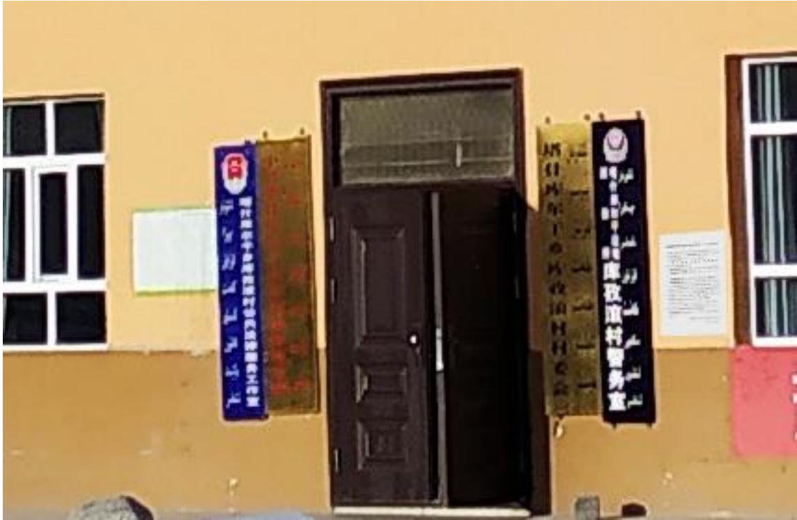
图 3-3 征求意见稿公示张贴照片