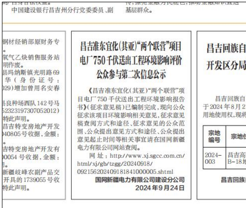
图3 第一次报纸公示照片