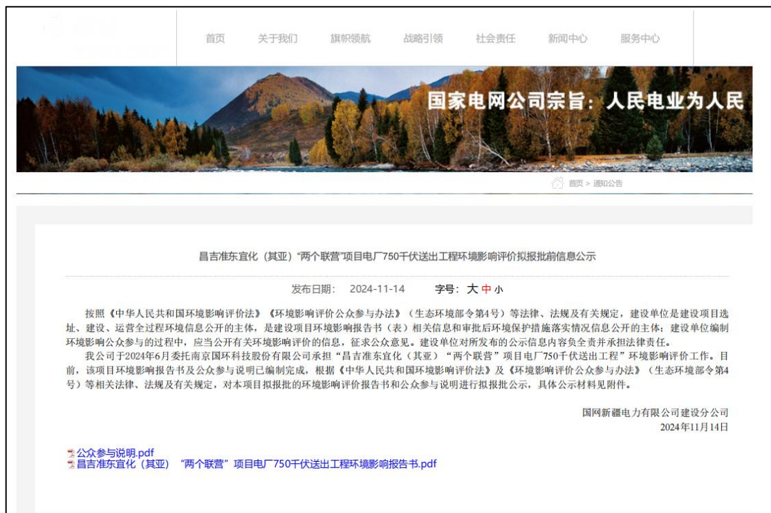
图5 拟报批稿网络公示截图