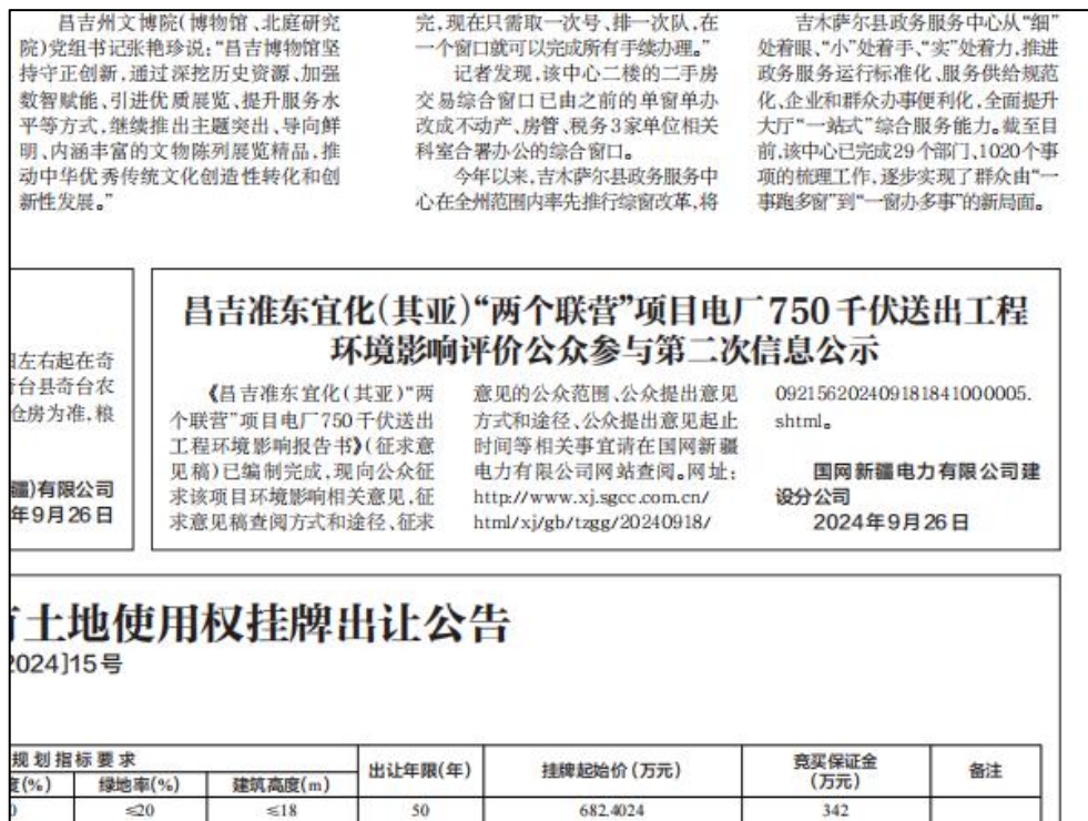
图4 第二次报纸公示照片