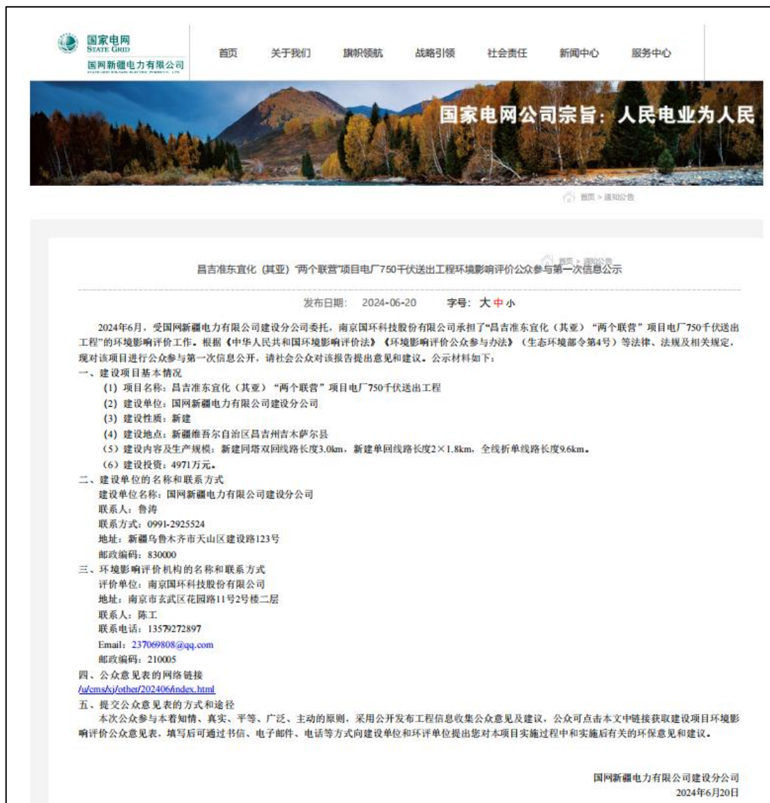
图1 本项目第一次网络公示截图

国网新疆电力有限公司建设分公司在国网新疆电力有限公司网站开展网络公示，载体选择符合《环境影响评价公众参与办法》要求。网络公示截图见图1。