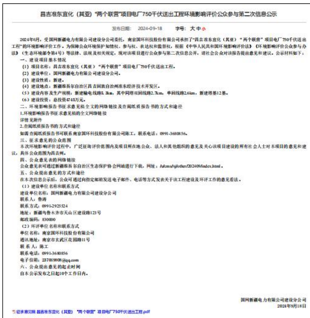
图2 征求意见稿网络公示截图