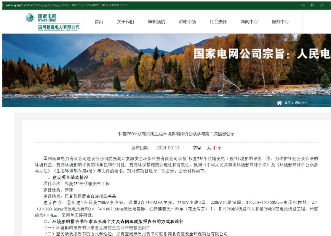
图2 征求意见稿网上公示截图