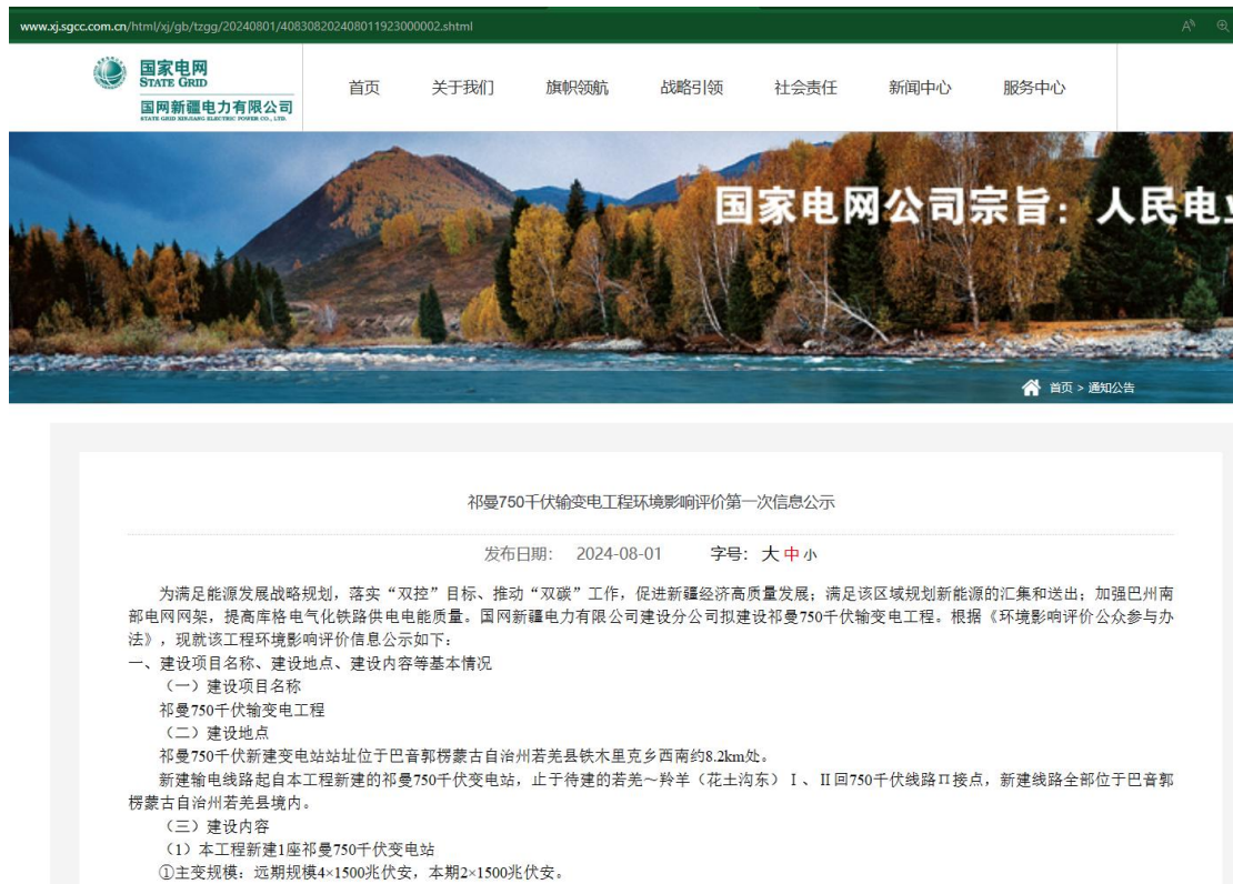
图 1 第一次公众参与网络公示截图