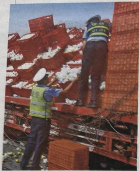
9月16日16时，轮台县公安局交警大队民警在阳霞服务区出口路段帮助驾驶人收拾掉落的货物。