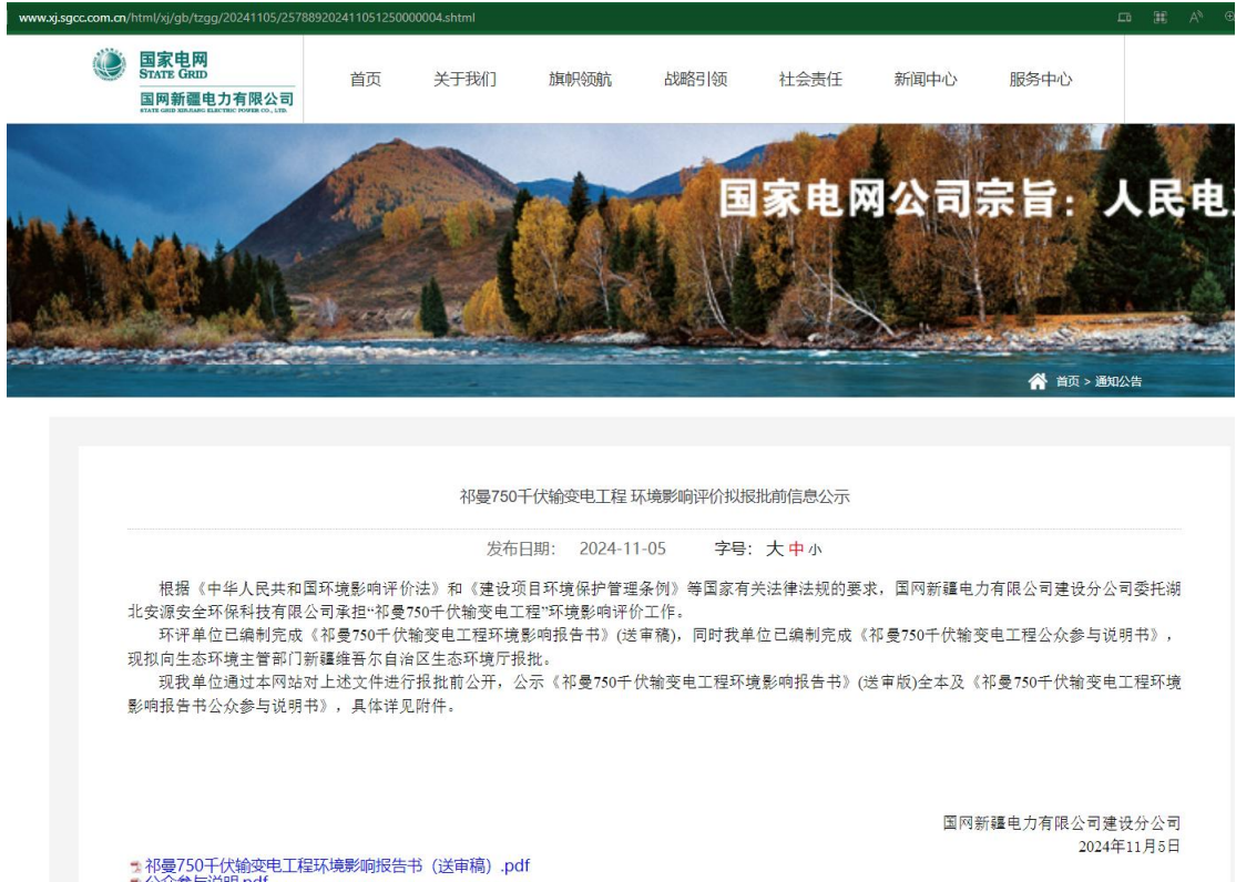
图 6 报批前网上公示截图