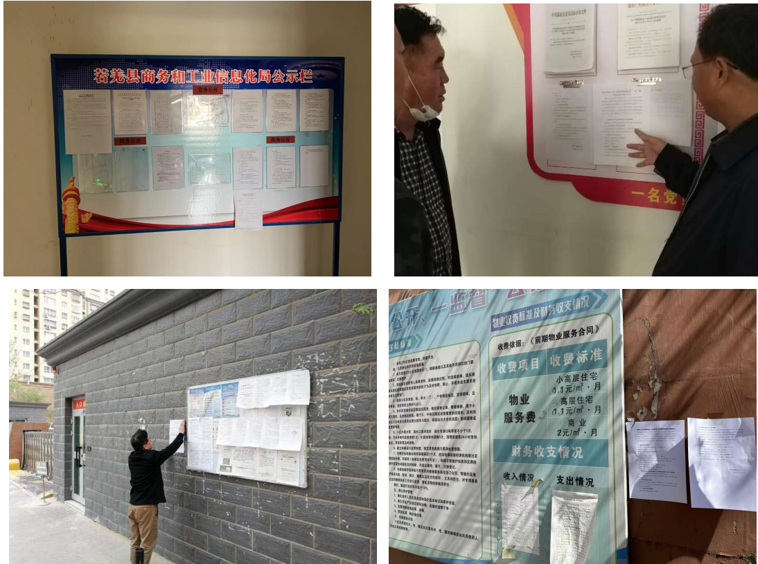
图5 本工程张贴公告照片

在第二次公示期间，我公司在项目所在地的若羌县及附近小区张贴了项目第二次公众参与信息公示，载体选择符合符合《环境影响评价公众参与办法》要求。