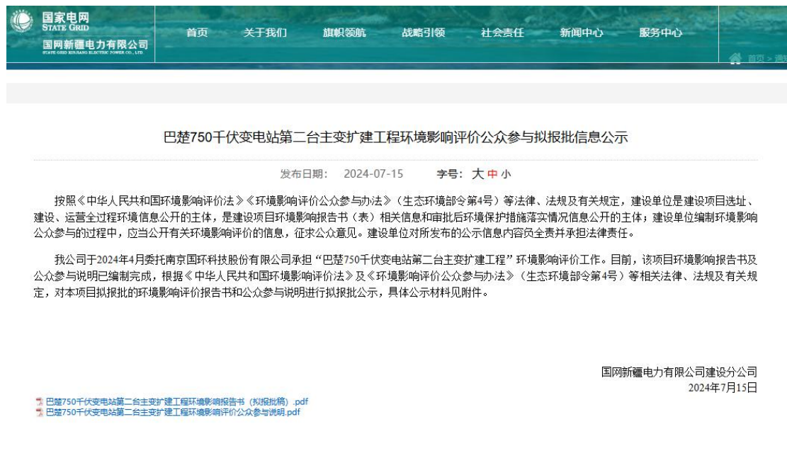
图 6.2-1 报批前网络公示截图