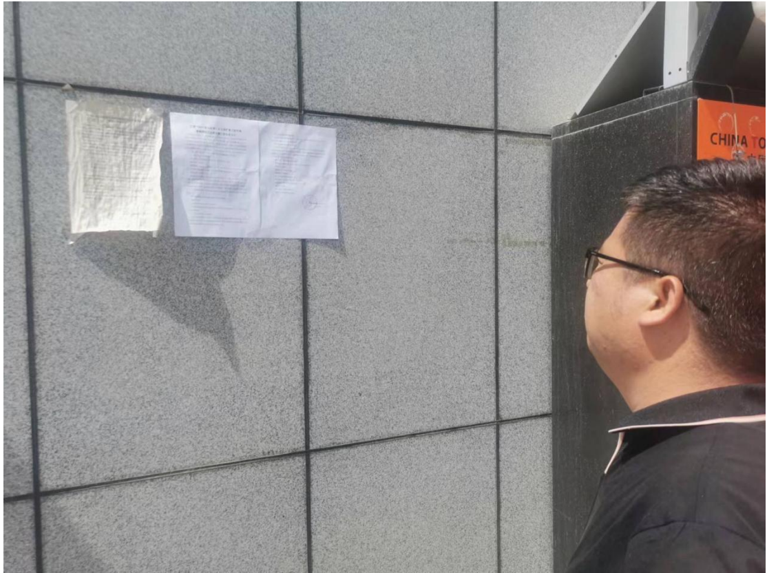
图 3.2-5 现场公示照片