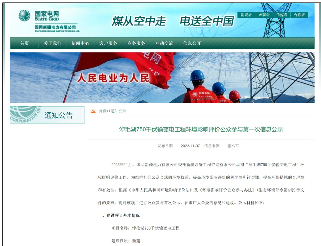
图 2.2-1 第一次网上公示

我单位在确定淖毛湖 750 千伏输变电工程环境影响报告书编制单位后，通过网络平台（国网新疆电力有限公司网站）开展了本项目首次环境影响评价信息公开。见图 2.2-1。