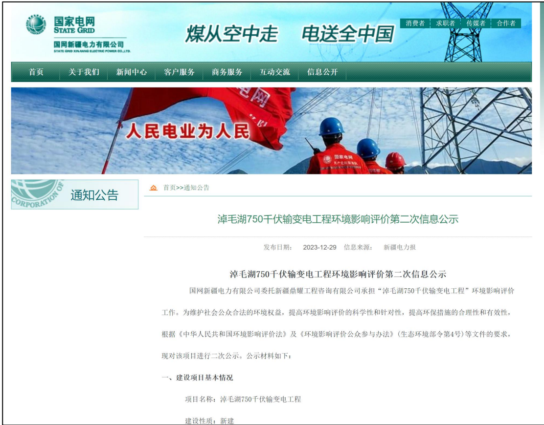
图 3.2-1 征求意见稿网上公示