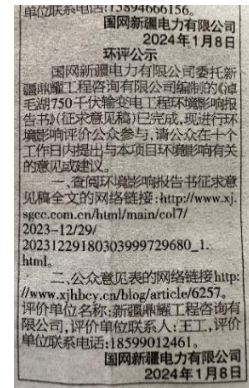
3.2-2 在新疆法制报发布本项目环境影响报告书征求意见稿信息