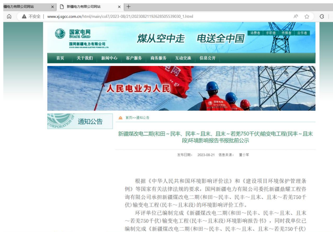
图 6-1 拟报批稿公示截图