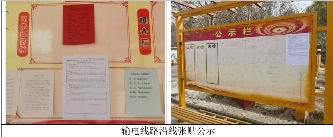
输电线路沿线张贴公示

本次环境影响评价公众参与公示调查在输电线路沿线村镇、县城等处张贴第二次公示，公示期限为10个工作日(2023年7月18日至2023年7月31日)。