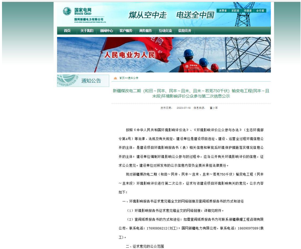
图 3-1 网站征求意见稿公示