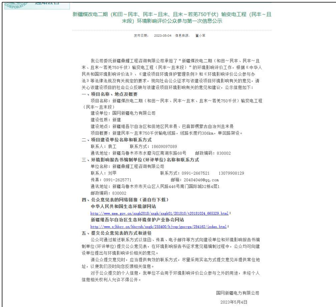
图 2-1 网站首次信息公示