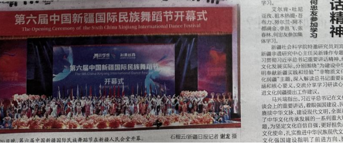
7月20日晚, 第六届中国新疆国际民族舞蹈节在新疆人民会堂开幕。