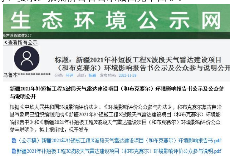
图 6-1 报批前公告公示截图

建设单位于 2022 年 11 月 28 日在“环保小智生态环境公示网”（ https://gongshi.qsyhbgj.com/h5public-detail?id=316124 ）公示了本项目环境影响报告书全文公示及公众参与说明公示。公开主要内容包括《新疆 2021 年补短板工程 X 波段天气雷达建设项目（和布克赛尔）环境影响报告书》及《公众参与说明》，所公开内容按规定未包含国家秘密、商业秘密、个人隐私等。符合《环境影响评价公众参与办法》（生态环境部令第 4 号）要求。报批前公告公示截图见下图 6-1