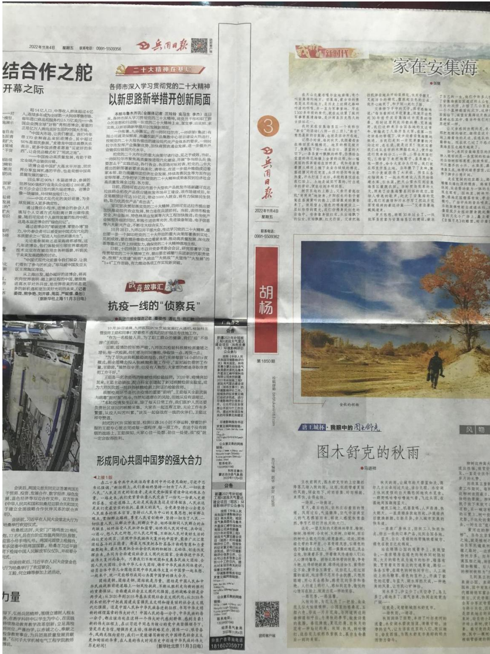
图 3-2 征求意见稿第一次报纸公示截图

建设单位分别于2022年11月4日及2022年11月5日，在兵团日报上对本项目的环境影响评价信息进行了两次公示，载体选择和公示时间符合《环境影响评价公众参与办法》要求。征求意见稿两次报纸公示截图详见图 3-2 及图 3-3。