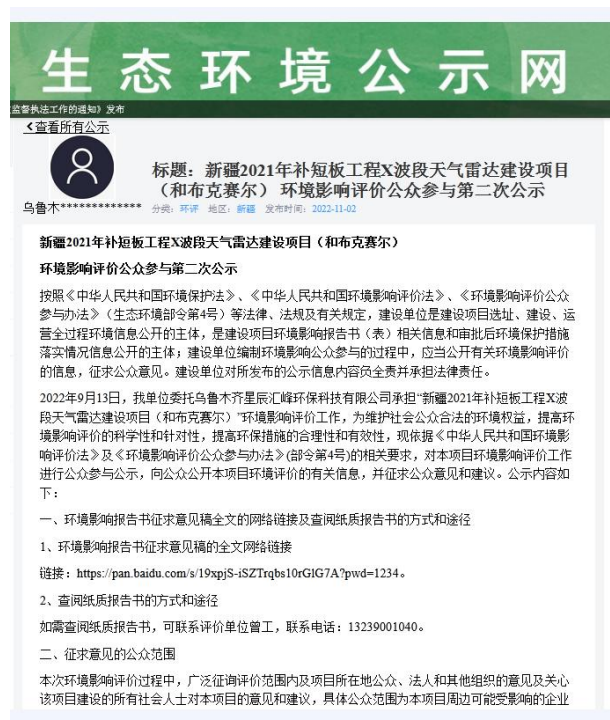
图 3-1 项目第二次公众参与公示截图

建设单位于 2022 年 11 月 2 日在“环保小智生态环境公示网”刊登了项目第二次公众参与公示信息（ https://gongshi.qsyhbgj.com/h5public-detail?id=312144 ），载体选择符合《环境影响评价公众参与办法》要求。公示截图详见图 3-1。