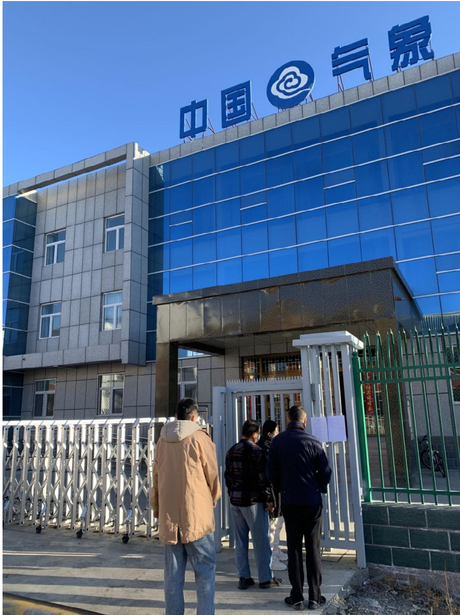
图 3-4 征求意见稿张贴公告公示截图 (b)