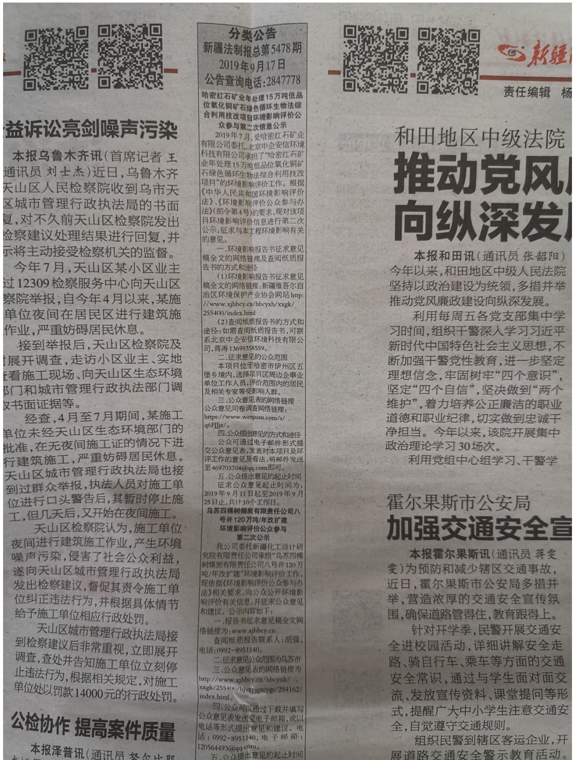
图4 本项目第二次报纸公示照片(9月17日)