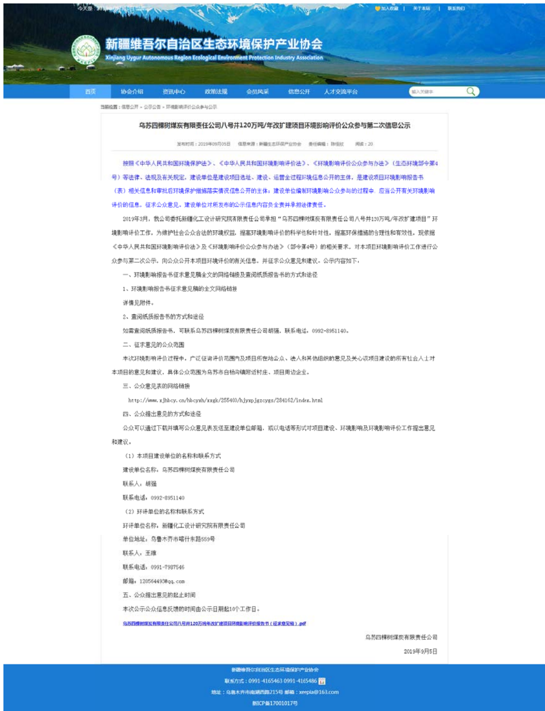
图 2 本项目征求意见稿网络公示截图