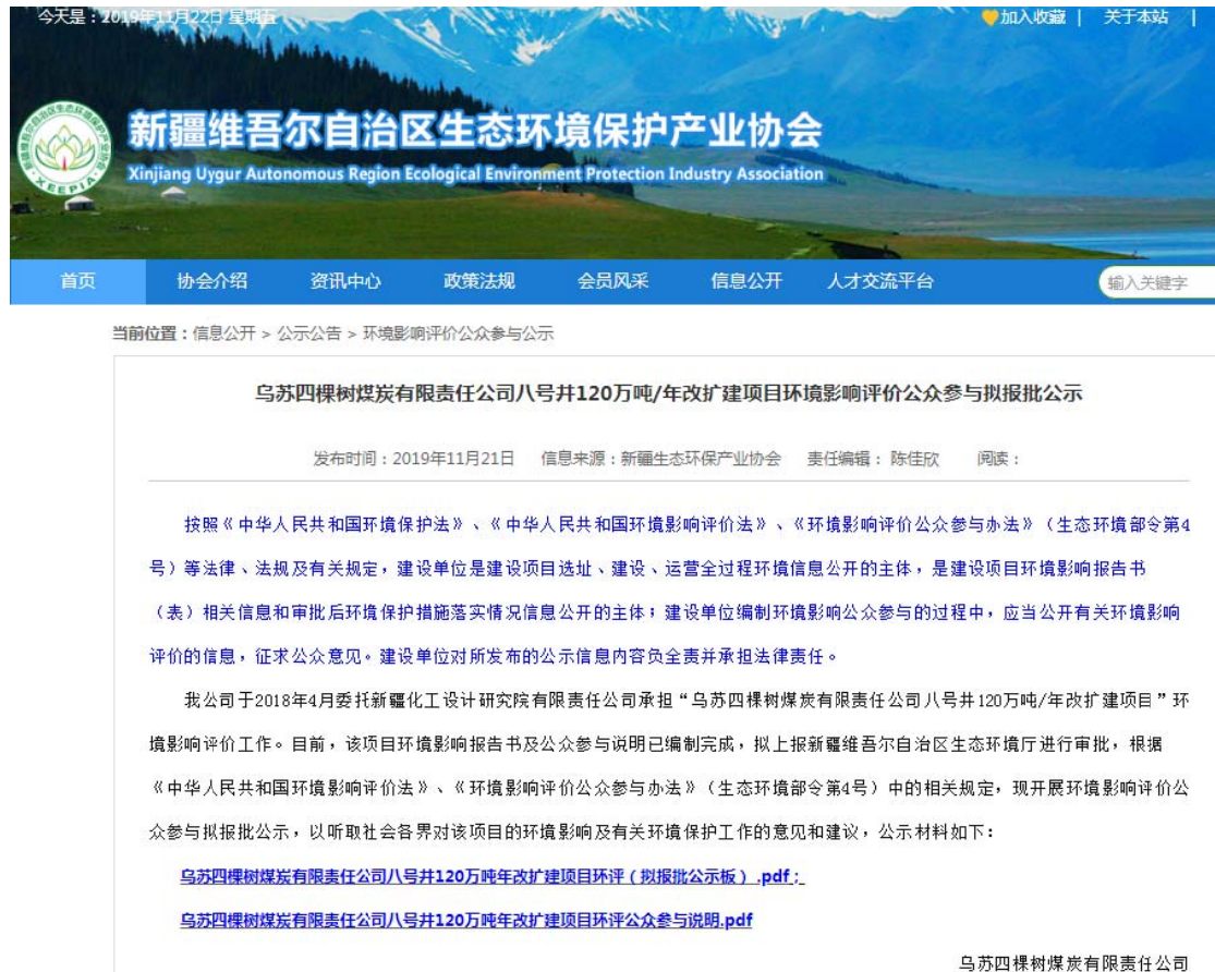
图 6 本项目拟报批公示网络截图