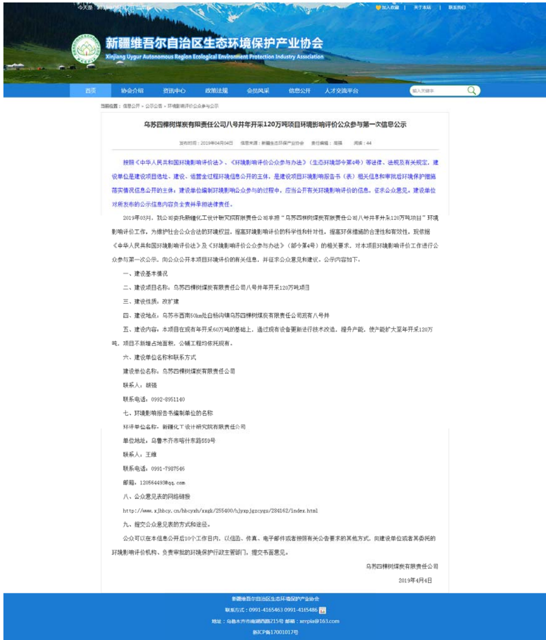
图 1 本项目第一网络公示截图